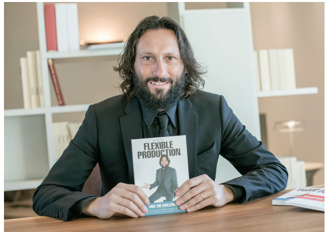
2 Gerade in Krisenzeiten sind innovative Produktionsmethoden ein Schlüssel zum Erhalt der Wettbewerbsfähigkeit

D ie Herausforderungen, die Covid-19 mit sich bringt, sind für einige Unternehmen des verarbeitenden Gewerbes der Ansatzpunkt dafür, Unterstützungsinitiativen zu bilden. Auch Porta Solutions, mit Hauptsitz in Villa Carcina in Italien, hat eine Initiative gestartet, die Anreize für Investitionen in Technologie bieten und die Hürden für einen Einstieg in effizientere Produktionstechnik senken soll. Gerade in den derzeit schwierigen Marktbedingungen ein wichtiges Argument, um den Folgen der Krise besser begegnen zu können.